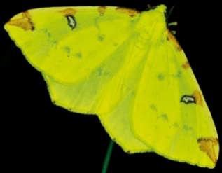
Braunes Langohr und Gelbspänner sind besonders lichtempfindlich.