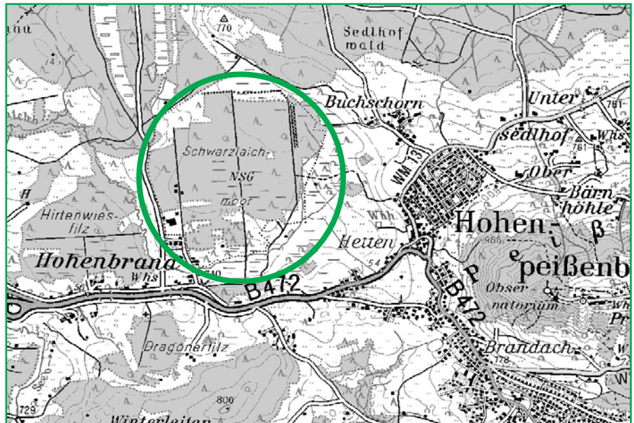
Lage des Naturschutzgebietes Schwarzlaichmoor