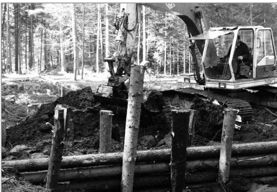
Einsatz von schwerem Gerät bei der Anlage eines Torfdammes mit Holzverbau im Schwarzlaichmoor.