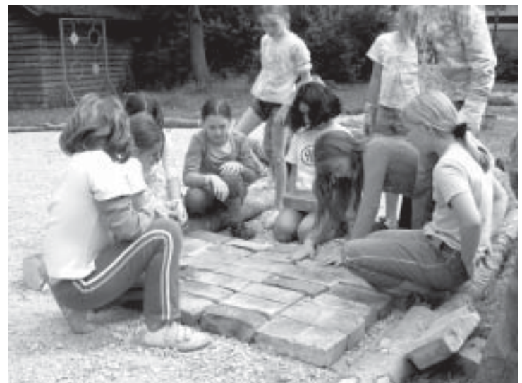
Bau eines Barfußpfades in Weilheim