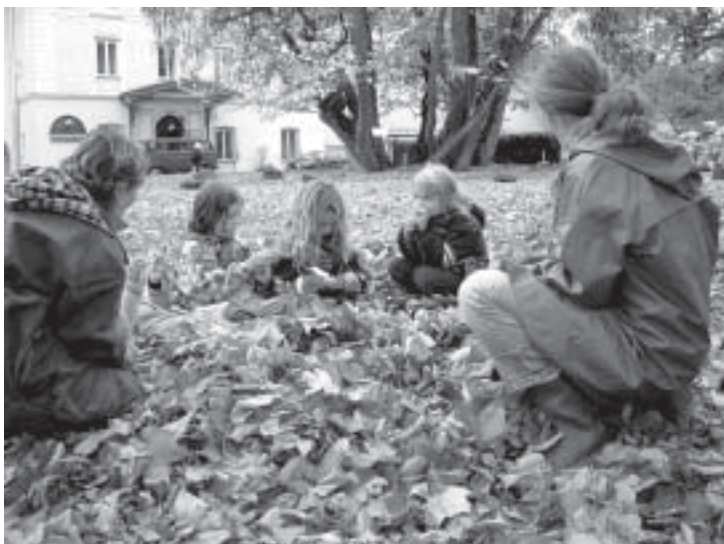
Meister Herbst in Bernried