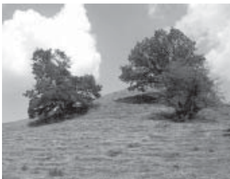
Drumlin am Hirschberg bei Weilheim